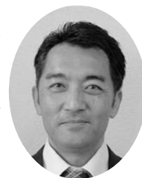
P T A 会 長