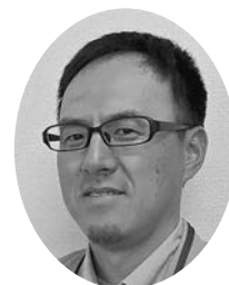
P T A 会長

師走に入り慌ただしくなり、令和元年も残りわずかとなって参りました。今年度の P T A も各委員会を中心に計画通り活動を進めることができています。活動に対しご理解とご協力をいただきました。会員の皆様に、深く感謝申し上げます。七月末から九日間の日程でオーストラリア短期留学に同行させて頂きました。海外という事の緊張や不安、そして新たな友との出会い、この先訪れる国際交流には何が何か？という事を学ばせて頂きました。(英語です)